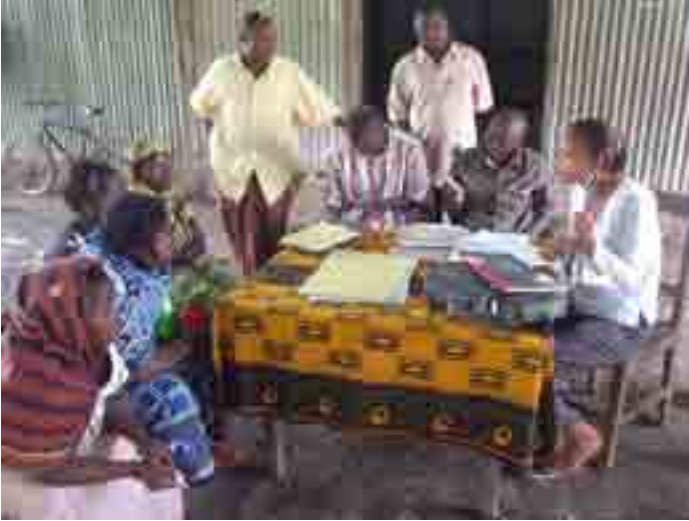
Mfanyakazi wa mradi wa maji akiwafundisha viongozi wa kijiji uendeshaji na usimamizi wa fedha kwa lengo la kutunza miundombinu ya maji (picha:2006)