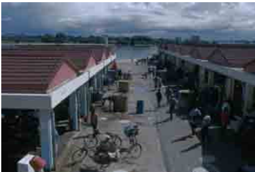
Soko la samaki Magogoni Dar es Salaam lilijengwa 2000

Maboresho mengi ya barabara kuu jijini Dar es Salaam yamefanyika kupitia misaada ya aina hii kutoka Japani.