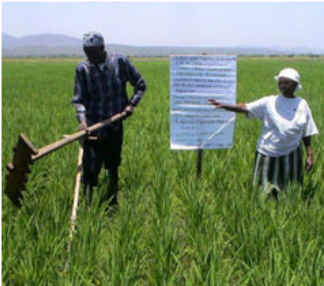
Mafunzo “kutoka kwa mkulima kwenda mkulima mwingine”: Mafunzo ya JICA yanazingatia masuala ya jinsia na uboreshaji endelevu wa maisha ya mkulima (picha:2005)