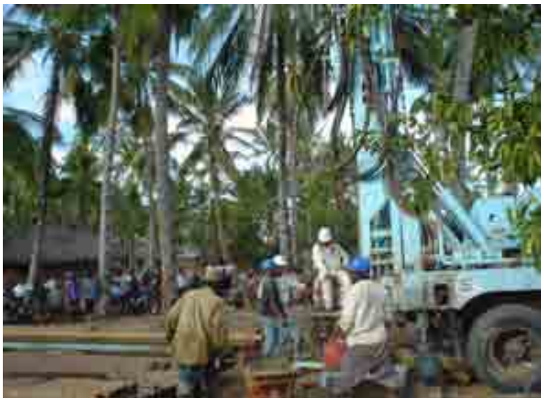
Wanakijiji wakiangalia kwa shauku kubwa ya maji kazi ya uchim-baji kisima Mtwara (picha:2005)

Mjini Zanzibar, JICA inatoa misaada ya kuboresha miundombinu ya maji na kuanzisha utaratibu wa ukusanyaji wa ankara za maji mjini.