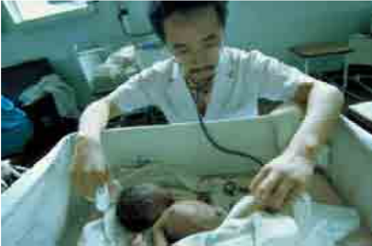
Mtaalamu wa JICA katika kitengo cha afya ya mama na mtoto katika hospitali ya Muhimbili