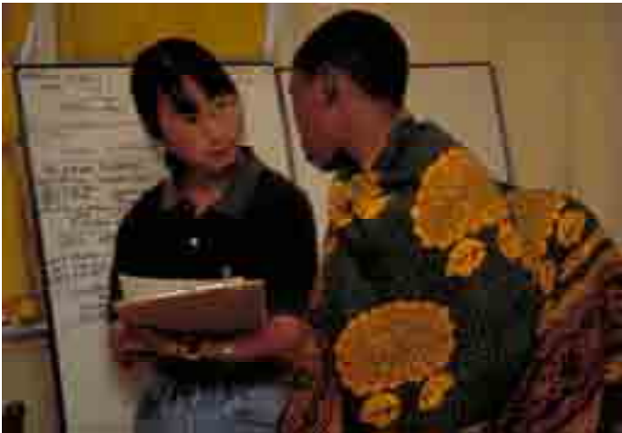
Muuguzi ambaye ni mmoja wa wafanyakazi wa kujitolea kutoka Japani akimhudumia mgonjwa Ilonga (picha:1997, Watanabe/JICA)