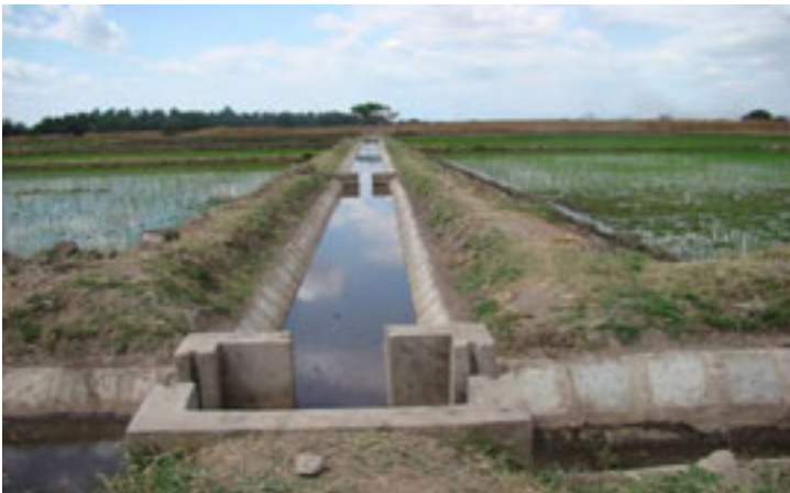
Skimu ya umwagiliaji maji katika Taasisi ya Mafunzo ya Wizara ya Kilimo Ilonga iliboreshwa kama maandalizi ya mafunzo ya kilimo cha mpunga, kupitia mradi wa Ushirikiano wa Kiufundi wa JICA (picha:2009 )