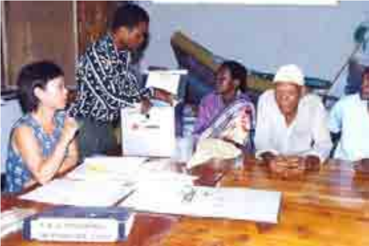
Mtaalamu wa kijapani akiwa na wanakijiji wa Pongwe mkoani Tanga, kwenye Mradi wa afya ya mama na mtoto (picha:1999)