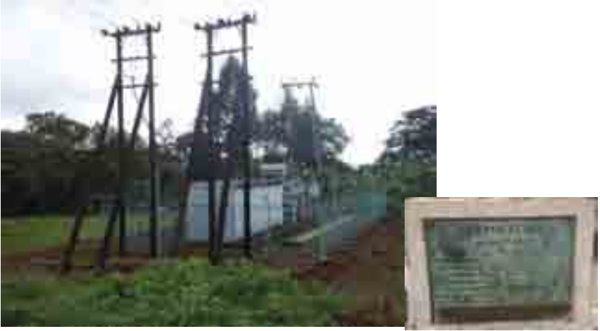
Moja ya vituo vidogo vya umeme katika eneo la Kilimanjaro vilivyojengwa mwaka 1985 chini ya mradi wa ugavi na usambazaji umeme mkoani Kilimanjaro (picha:2009)