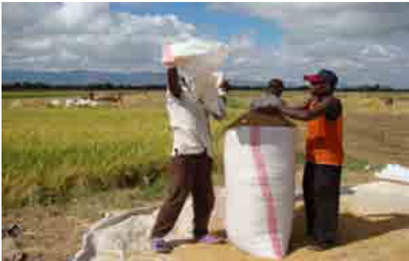
Wakulima wakivuna mpunga katika skimu ya umwagiliaji maji Moshi vijijini (picha:2007)

Moja ya miradi inayoendelea una lengo la kueneza mafanikio haya katika maeneo mengine mengi nchini kwa kuimarisha mfumo wa uenezaji ufundi wa kilimo cha umwagiliaji maji.