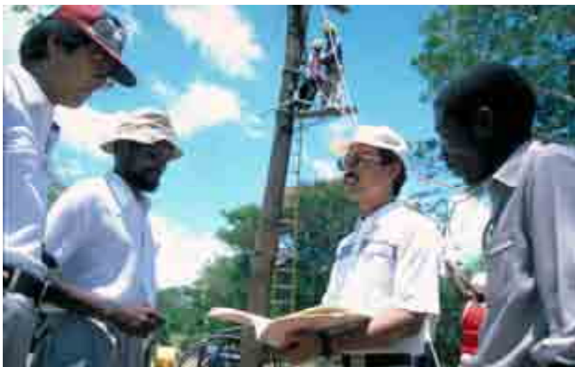
Wahandisi wa kijapani wakiwa na wahandisi wa TANESCO katika mradi wa kuhuisha na kurekebisha mfumo wa usambazaji wa umeme Dar es Salaam

Kwa jitihada hizi hali ya upatikanaji wa umeme imekuwa bora zaidi ikilinganishwa na miaka 30 iliyopita.