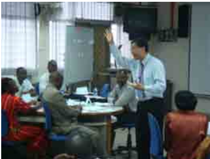
Walimu wa Sayansi na Hesabu kutoka nchi mbalimbali za Asia na Afrika wakiwa katika mafunzo huko Malaysia (picha:2008)

Baada ya mafunzo haya, washiriki hujiunga na Chama cha Watanzania waliopata mafunzo nchini Japani chini ya JICA (JATA) na huendelea kushirikishana uzoefu na washiriki waliopita na hivyo kuchangia maendeleo ya jamii.