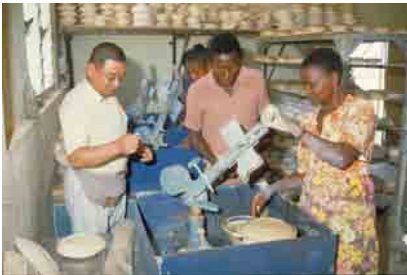
Mtaalamu wa kijapani akiwa katika kituo cha maendeleo ya viwanda mkoani Kilimanjaro (picha:1986, Fujii/JICA)

Mtaalamu wa kwanza wa kijapani alikuja nchini Tanzania mnamo mwaka 1965 katika nyanja ya mazao yatokanayo na mianzi (bamboo products). Kupitia ushirikiano wa kiufundi katika nyanja za kilimo, afya, maendeleo ya miundo mbinu na nyinginezo, JICA inasaidia kukuza uwezo wa Watanzania kwa ajili ya maendeleo ya kijamii na uchumi wa Tanzania.