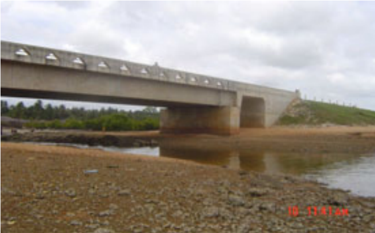
Madaraja manne katika barabara kuu kati ya Mtwara na Lindi yalijengwa kwa msaada kutoka Japani kufuatia uharibifu mkubwa uliosababishwa na mafuriko mwaka 1990. Mradi huu umerahisisha usafiri katika eneo hili (picha:2010)