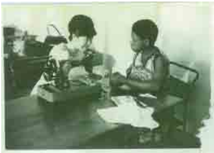
Mmoja katika kundi la kwanza la JOCV akimfundisha mwanafunzi mbinu za ushonaji (picha:1967)

Tangu kuanzishwa kwa mpango huu, takribani JOCVs 1300 wame-shaletwa nchini kufanya kazi katika maeneo na nyanja mbalimbali kama vile: kilimo na uvuvi, elimu, afya, umakenika na kazi za kijamii.