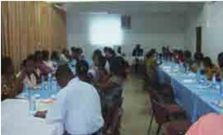
Wauguzi ambao ni miongoni mwa wanachama wa JATA wakibadilishana uzoefu katika warsha juu ya PMTCT (picha:2010)