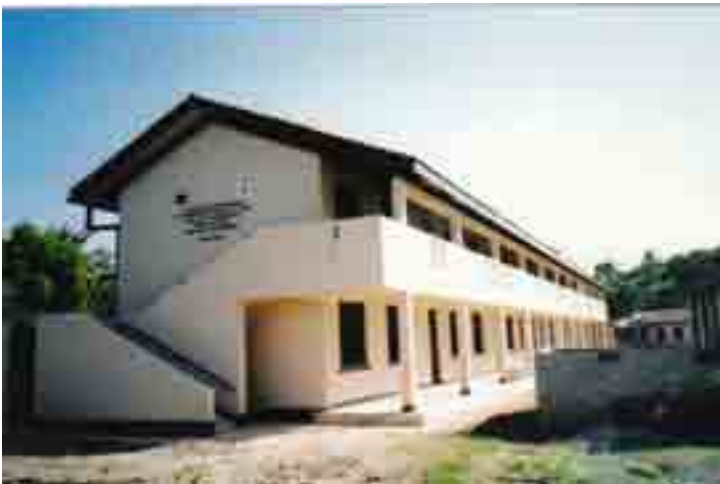
Madarasa yaliyojengwa katika Shule za Msingi jijini Dar es Salaam