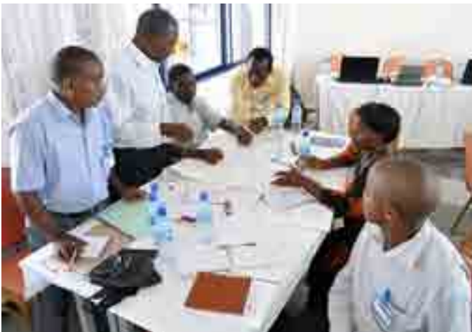
Mafunzo ya wahamasishaji wa mchakato wa Fursa na Vikwazo kwa Maendeleo (O and OD) ambayo yalifanyika kupitia ushirikiano wa kiufundi wa JICA (picha:2010)