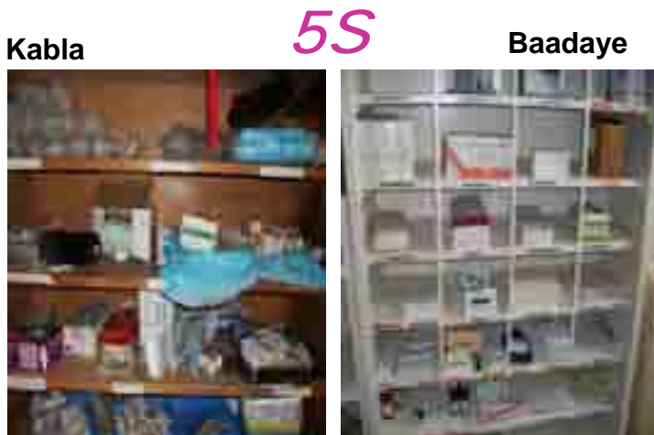
JICA inasaidia kuboresha mazingira ya kazi kwa kutumia kanuni ya “5S (Sasambua, Seti, Safisha, Sanifisha, Shikilia)” kama msingi wa kuboresha huduma za afya katika hospitali kadhaa nchini