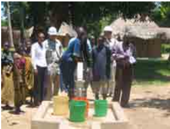
Mradi wa Maji Lindi