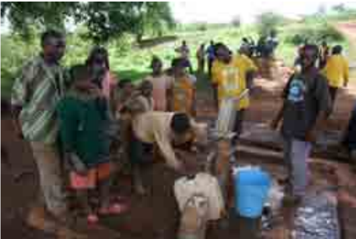
Katika mkoa wa Kagera, huduma za maji katika maeneo yali-yoathiriwa na wakimbizi ziliboreshwa kwa kupitia misaada ya Japani mwaka 1996 (picha:2008)