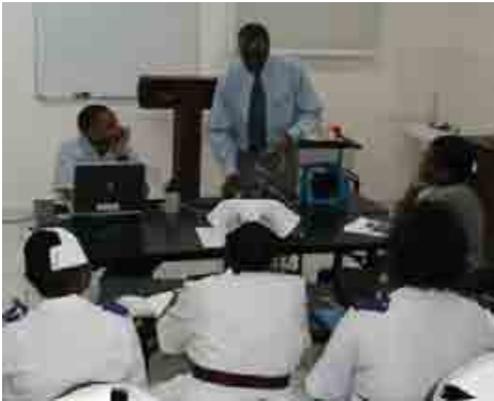
Wauguzi wakiwa katika warsha ya matibabu kwa watoto (picha:2005)

Vile vile madaktari wa watoto na wauguzi kote nchini wamekuwa wakipatiwa mafunzo ndani ya Tanzania kwa msaada wa JICA ili kuboresha elimu na ujuzi wao.