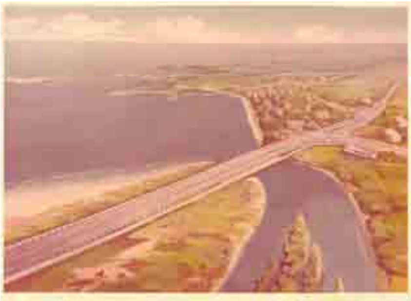
Daraja la Selander - Mradi wa kwanza wa barabara kufadhiliwa na Japani jijini Dar es Salaam, na ujenzi wake ulianza mwaka 1980 (Mchoro wa kubuni kazi)

Aidha mwaka 1966, mpango wa wafanyakazi wa kujitolea kutoka Japani (JOCV) ulianzishwa na mwaka huo huo, ofisi ya idara hiyo ilifunguliwa jijini Dar es Salam. Kwa kadri mahusiano kati ya Japani na Tanzania yalivyozidi kupanuka, JICA iliipandisha hadhi ofisi ya JOCV na kuwa ofisi kamili ya JICA mwaka 1980.