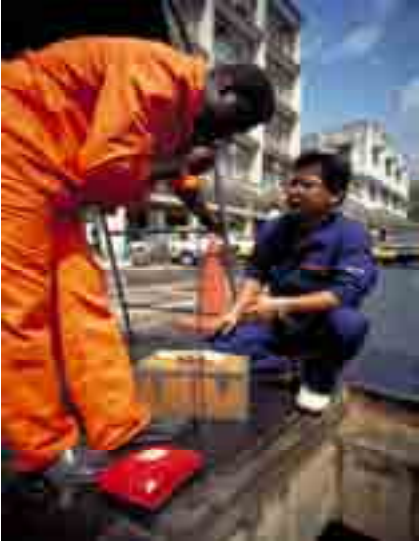
Mfanyakazi wa kujitolea akisaidia matengenezo ya simu jijini Dar es Salaam