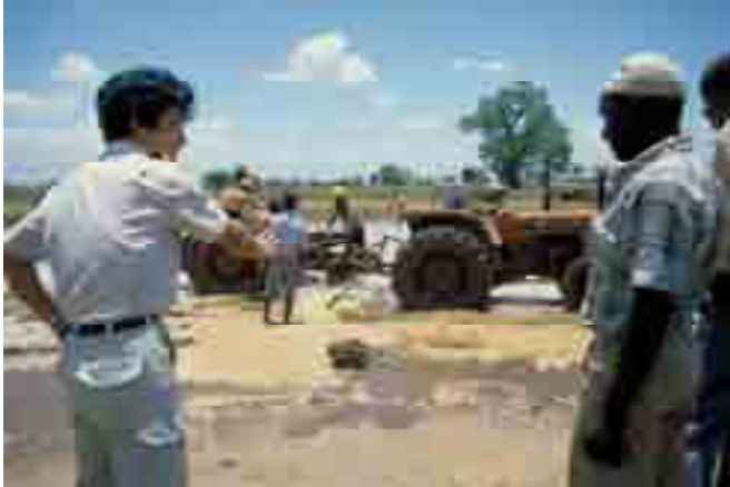
Mtaalam wa kijapani akielekeza wakulima jinsi ya kulima mpunga kwa kutumia trekta katika skimu ya umwagiliaji maji Moshi vijijini (picha:1986, Fujii/JICA)