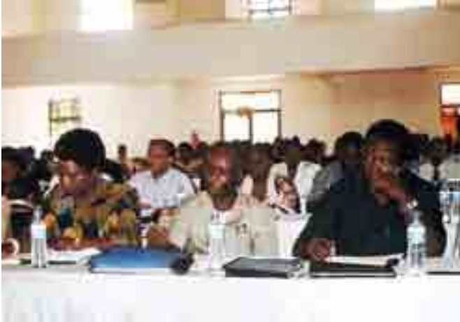
Mkutano wa kwanza wa Chama cha Tanzania na Osaka ambacho kilianzishwa mwaka 2006 kwa lengo la kuimarisha ushirikiano baina ya Serikali za Mitaa na hivyo kuenza yale mazuri waliyojifunza Japani (picha:2008)