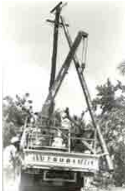
Vifaa vya ugavi na usambazaji wa umeme Dar es Salaam (picha:1999)